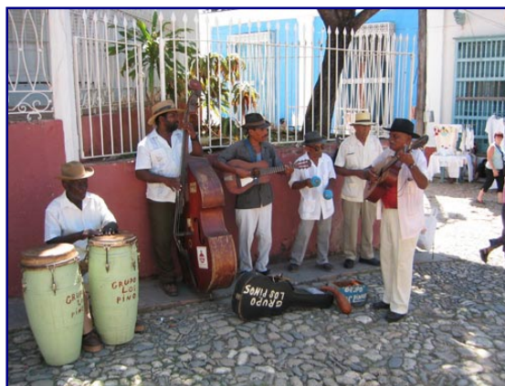
Lokal musikgrupp i Trinidad