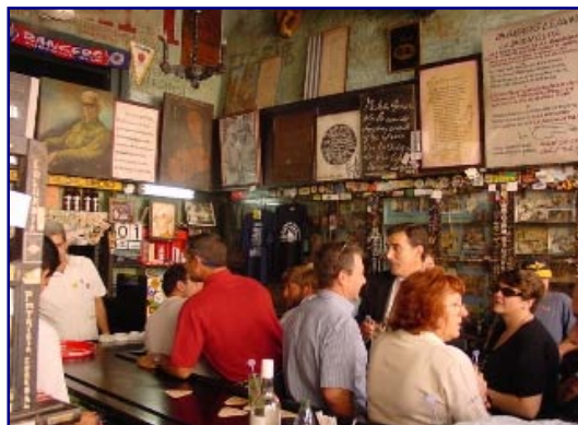
Bodeguita Del Medio

Resten av eftermiddagen tillbringas vi på egen hand. Det kan vara trevligt med att besöka marknaden i Gamla Stan, eller varför inte koppla av med en Mojito på Bodeguita del Medio eller en Daiquiri på El Floridita. Eller kanske svalka sig med ett dopp i hotellets swimmingpool.