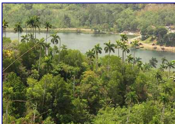
Floden San Juan

För de som väljer att stanna på Kuba finns möjligheten att njuta av en fortsatt härlig semester på någon av de underbara stränderna. De som önskar uppleva det fascinerande östra Kuba kan direkt ansluta till "Cradle of the Revolution tour".