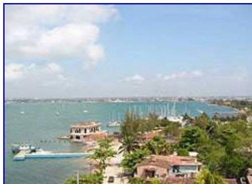
Utsikt över Cienfuegosbukten från Hotel Jagua

Efter att vi har checkat in på Hotel Jagua äter vi en trevlig middag på hotellet.