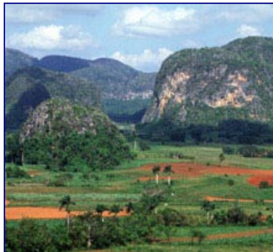
Piñar Del Rio

Efter frukost väntar oss en sightseeingtur över Cienfuegos innan vi beger oss mot Piñar Del Rio provinsen, en region som är känd över världen som Kubas främsta område för tobaksodling och där de karakteristiska "Mogote" bergen står vakt över grönskande dalar.